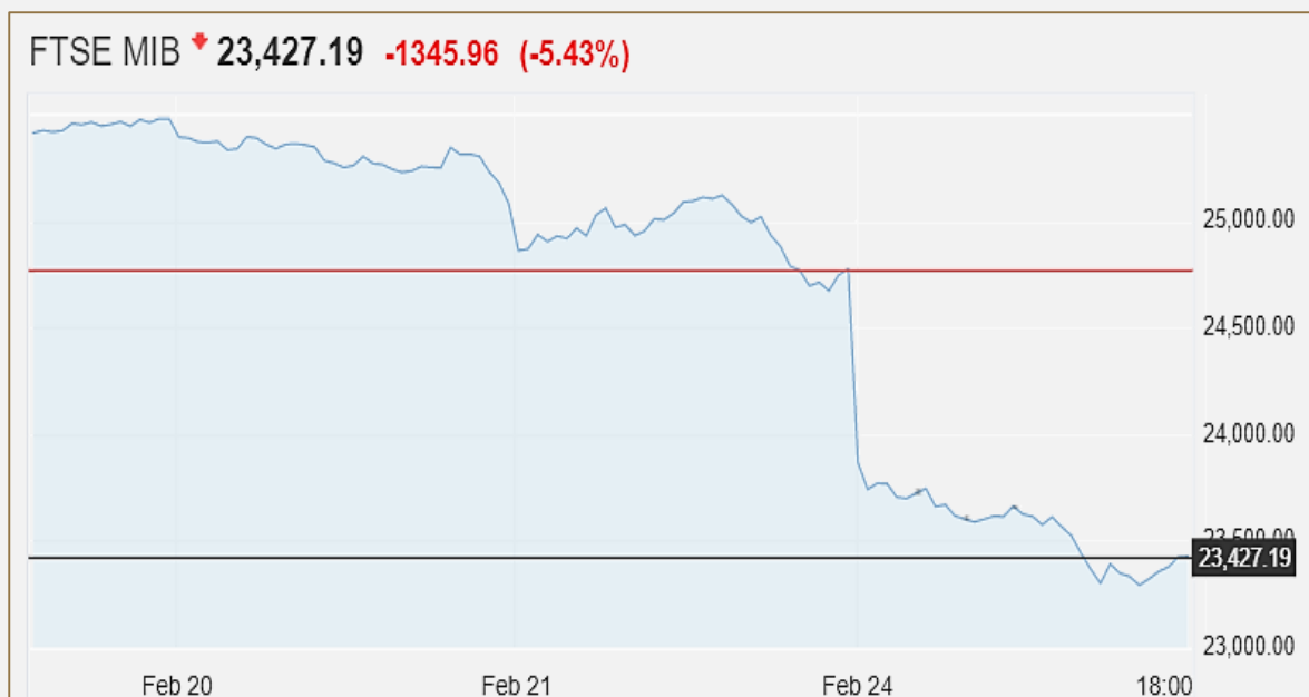
Figure 1: Kretanje vrijednosti italijanskog indexa FTSE MIB

Evropska tržišta osjetila su pad početkom jučerašnjeg trgovanja, a italijanskim index-om FTSE MIB trgovalo se za 1.345 bodova niže pa je sada na nivou od 23.430 poena ili oko 5,4% niže. Akcije italijanskih banaka naglo su pale, dok su akcije fudbalskog kluba Juventus u padu od oko 11%.